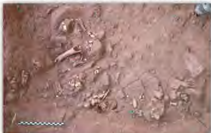
Vue de la fouille en 2014: os de renne et outils en roche taillée.

C'est ainsi que dès 2009 une équipe de scientifiques européens mène des campagnes de fouille qui, jusqu'à présent, confirment l'incroyable conservation des vestiges, asseyant la renommée du gisement au niveau européen. En effet, plusieurs niveaux archéologiques ont pu être reconnus, renfermant de nombreux outils taillés (près de 2500 ont été pour le moment retrouvés). Ces derniers sont réalisés dans différentes matières premières locales, majoritairement des galets présents dans la vallée de la Bruche (rhyolite, phtanite, quartz). De plus, un nombre impressionnant de restes de faune a également été mis à jour. Des os qui permettent de reconstituer le paysage de l'époque, à savoir un environnement ouvert, de type steppe, puisque ce sont majoritairement des restes de mammoths, de rennes, de chevaux et de bisons qui ont été retrouvés dans les niveaux archéologiques. Ces os portent fréquemment des traces de découpe, attestant bien du caractère anthropique de leur accumulation et des activités de boucherie pratiquées sur le site. Enfin, des traces de feu ont été retrouvées en 2014.