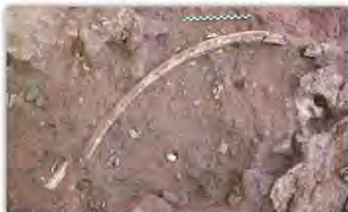
Vue de la fouille en 2014 : os de mammoth (côte de mammoth au centre) et outils en roche taillée

Enfin, afin de valoriser ces premiers résultats très prometteurs, une journée porte-ouverte a pu être organisée le 19 juillet dernier permettant à près de 300 visiteurs de découvrir le site. De plus, un partenariat est noué avec le collège Louis Arbogast de Mutzig et le PAIR, permettant ainsi à des collégiens, de s'approprier ce patrimoine archéologique singulier tout au long de l'année scolaire 2014/2015.