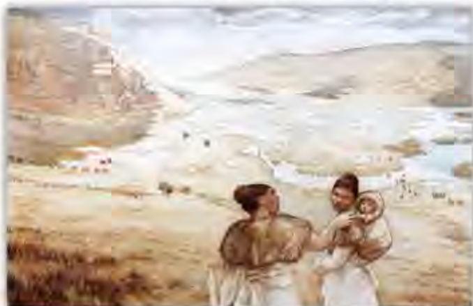
Reconstitution du gisement de Mutzig à l'époque préhistorique

C'est ainsi que dès 2009 une équipe de scientifiques européens mène des campagnes de fouille qui, jusqu'à présent, confirment l'incroyable conservation des vestiges, asseyant la renommée du gisement au niveau européen. En effet, plusieurs niveaux archéologiques ont pu être reconnus, renfermant de nombreux outils taillés (près de 2500 ont été pour le moment retrouvés). Ces derniers sont réalisés dans différentes matières premières locales, majoritairement des galets présents dans la vallée de la Bruche (rhyolite, phtanite, quartz). De plus, un nombre impressionnant de restes de faune a également été mis à jour. Des os qui permettent de reconstituer le paysage de l'époque, à savoir un environnement ouvert, de type steppe, puisque ce sont majoritairement des restes de mammoths, de rennes, de chevaux et de bisons qui ont été retrouvés dans les niveaux archéologiques. Ces os portent fréquemment des traces de découpe, attestant bien du caractère anthropique de leur accumulation et des activités de boucherie pratiquées sur le site. Enfin, des traces de feu ont été retrouvées en 2014.